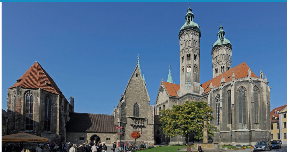
Stern Naumburg Dom mit Domplatz